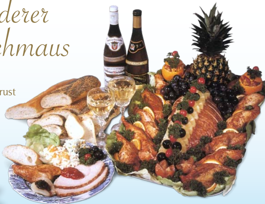
gemischte Puten- und Hähnchenplatte